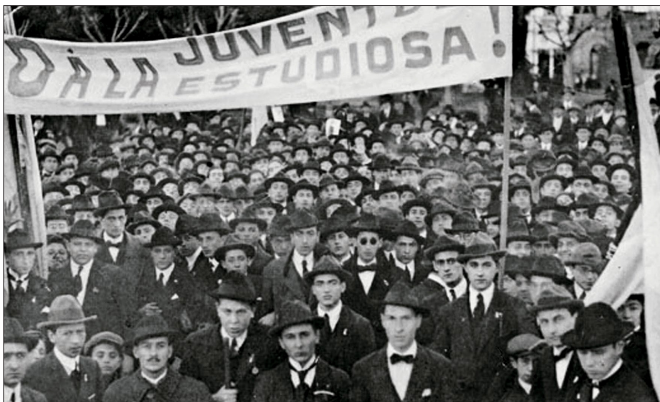
Manifestación estudiantil durante el Movimiento de Córdoba en Argentina, 1918.

El Movimiento de Mayo de 1968 en París, con el lema "la imaginación al poder", tuvo un eco mundial que cuestionó la cultura política, el silencio frente a las injusticias y el autoritarismo, abriendo un primer período de profundas transformaciones sociales y políticas. En esa onda de metamorfosis social a nivel mundial, en Ecuador, en 1969, se eliminaron los exámenes de ingreso y se permitió la apertura de nuevas universidades por todo el país (Pacheco, 2015), lo que se consolidaría con la reforma universitaria impulsada por Manuel Agustín Aguirre. Las universidades en el mundo ampliaron así el acceso a sus aulas; la promesa del capitalismo en su segunda fase se encarnaba en