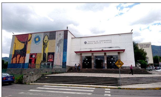
Universidad Central del Ecuador.

Enfrentar estas transformaciones solo será posible a partir de núcleos fuertes y dinámicos dentro de las comunidades académicas, en cada universidad, para desplegar acciones efectivas sin perderse en la digitalización y la estandarización, aprovechando al máximo las capacidades de todos los miembros de la comunidad: estudiantes, docentes y trabajadores.