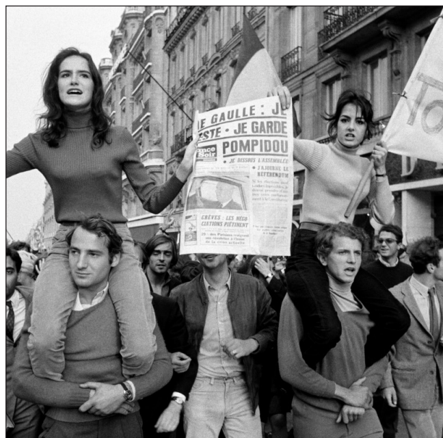
Manifestación estudiantil en París, 1968.

Burawoy (2011) observa, en este contexto, dos conjuntos de presiones externas que afectan negativamente a las universidades, independientemente de su ubicación: la mercantilización, que se traduce en acciones orientadas a la obtención de financiamiento público o privado a cambio de la producción de conocimiento, y la creciente importancia de los rankings globales, que constituyen dispositivos de gobernanza del conocimiento global. Estas presiones, siguiendo a Burawoy, han generado cuatro tipos de crisis dentro de las universidades: una crisis de gobierno, entre el sistema colegiado y los controles tecnocráticos; una crisis de legitimidad, producto de la venta más o menos explícita de servicios educativos, lo que ha debilitado la concepción de servicio público; una crisis financiera, originada por la dismi-