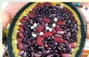
Primer encuentro internacional de custodios de semillas http://karisma.org.co/frutosdeutopia/index.php/tag/semillas/

Los integrantes de la Fundación Aotus han configurado una red interinstitucional de custodios de semillas en colegios campesinos, preocupados por la identidad cultural de