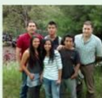
Estudiantes de la Licenciatura en Biología y Educación Ambiental de la Universidad del Quindío e integrantes de la Fundación Aotus.

Los estudiantes del Programa de Licenciatura en Biología y Educación Ambiental de la Universidad del Quindío, pertenecientes a la Fundación Aotus, participaron con varios trabajos de investigación enmarcados en los campos de la pedagogía social para la inclusión, la construcción social del conocimiento y la defensa de la vida, durante el Cuarto Seminario