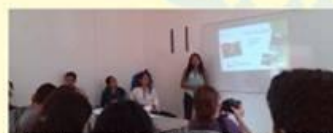
Expositores en el Cuarto Seminario Internacional y Octavo Simposio Nacional

Impedir el deterioro de la memoria natural y cultural de las comunidades campesinas en el departamento y en Colombia, fomentando el diálogo de saberes y el intercambio de experiencias, así como el encuentro entre generaciones de campesinos y campesinas, constituyen algunos de los objetivos primordiales de estos estudiantes del programa de Licenciatura en Biología.